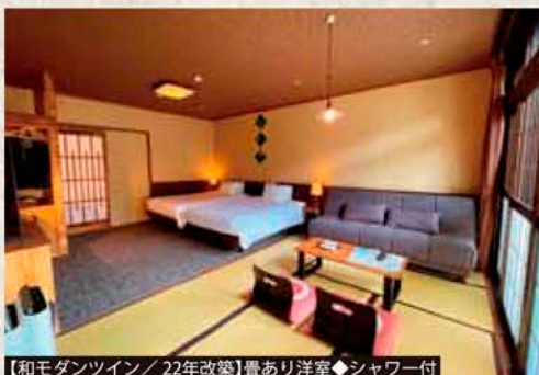
【和モダンツイン/22年改築】畳あり洋室◆シャワー付