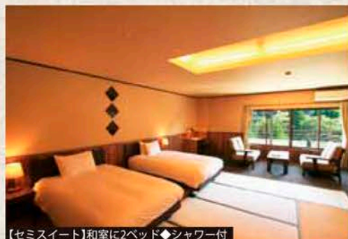
【セミスイート】和室に2ベッド◆シャワー付