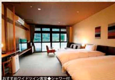
おすすめワイドツイン客室◆シャワー付